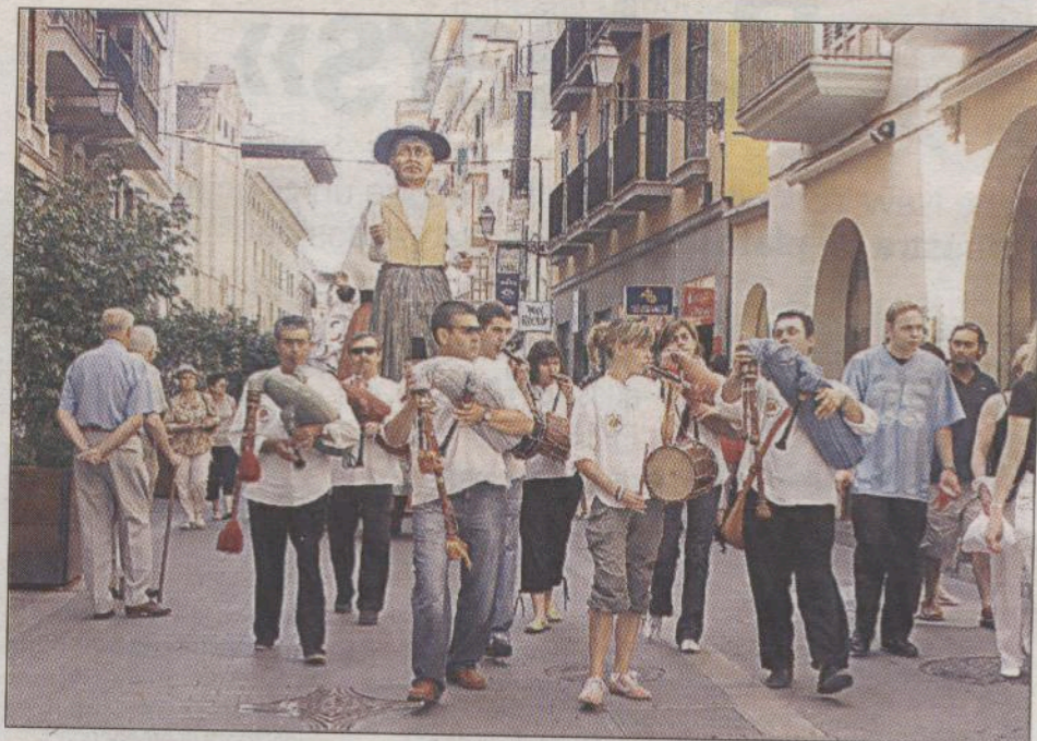
Uno de los primeros actos fue un pasacalles de los «gegants» por el centro de Palma.